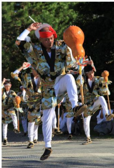
加東市美術展平成29年入選 千年の継承 丹波市氷上町谷村

続いて堺筋本町：中国海鮮酒家「李白」に場所を移し、懇親会を行いました。講演内容への質問や、更には在学時の思い出など話題は尽きることなく、初参加の若い方も交じって懇親を深めました。