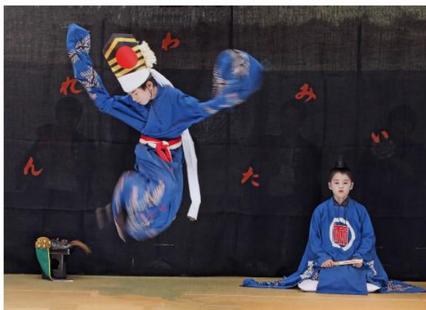
加東市公募展平成30年 優秀賞 動と静 丹波市氷上町稲畑